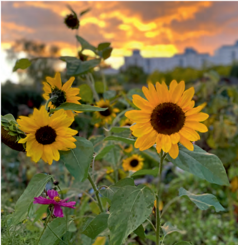
Nachbarschaftsgarten Beettinchen