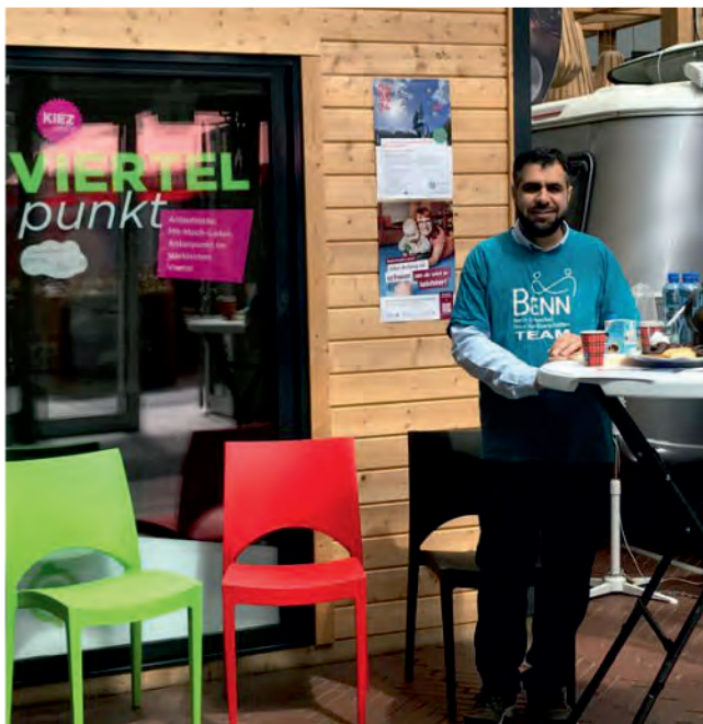
Beratung im Informationsbüro VIERTELpunkt

BENN spricht regelmäßig mit dem Bezirksamt Reinickendorf über wichtige Themen und Anliegen aus dem Viertel. So fließen z. B. Die Ergebnisse unserer Nachbarschaftsforen in die Planungen des Bezirks ein. Auch die Themen Einsamkeit oder psychische Gesundheit sind uns ein Anliegen. Oder stört dich z. B. das Bauloch im Märkischen Zentrum? Wir können es nicht beheben. Aber wir unterstützen dabei, dass Informationen über die Baustelle weitergegeben werden, sobald es welche gibt.