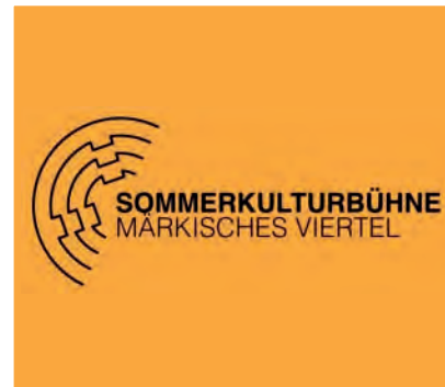
Logo der Sommerkulturbühne