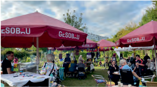
Ein Fest im Nachbarschaftsgarten Beettinchen, Quelle: BENN im MV