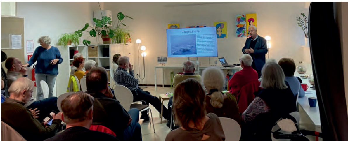
Veranstaltung zum Thema Demokratie und 35 Jahre Mauerfall

Unsere Aufgabe ist es, die Nachbarschaft über Projekte und Entwicklungen im Viertel und in Reinickendorf zu informieren. Im Nachbarschaftscafé geht es z. B. um Arbeitssuche, Familie (Erziehung, Schule, Freizeit), Menschenrechte, Rassismus und Diskriminierung, unser Gesundheitssystem, aktuelle Entwicklungen im Märkischen Viertel und viele weitere Themen. Wir geben auch Informationen vom Bezirksamt Reinickendorf weiter. BENN unterstützt Aktionen zum Klima- und Umweltschutz, z. B. Kleidertausch oder Reparaturaktionen. Wünsche aus der Nachbarschaft geben wir an unser Netzwerk weiter.