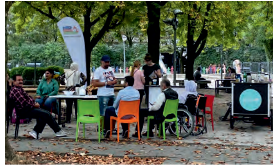
Das mobile Nachbarschaftscafé

BENN bringt Nachbarinnen und Nachbarn zusammen. Unsere Projekte und Veranstaltungen stärken das Miteinander in der Nachbarschaft. Wir wollen, dass sich alle im Märkischen Viertel wohlfühlen und sich mit ihren Ideen einbringen.