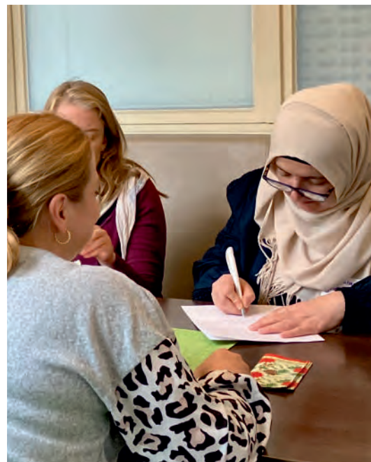
Veranstaltung „Erzähl doch mal“ zu 60 Jahre Märkisches Viertel